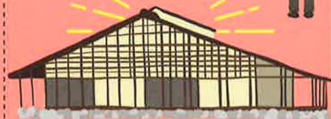
大桑村歴史民俗資料館