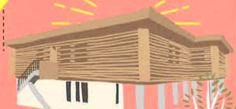
天龍村文化センター