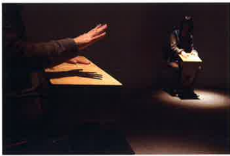
《Vibracion Cajon (ヒブラシオン・カホン)》2008年

手や耳を通して世界に触れると、見るだけで分かっていたつもりになっていたとは違った世界が広がるかもしれません。視覚だけでなく触覚や聴覚などの多様な感覚を使って、「触れる」体験をお楽しみください。