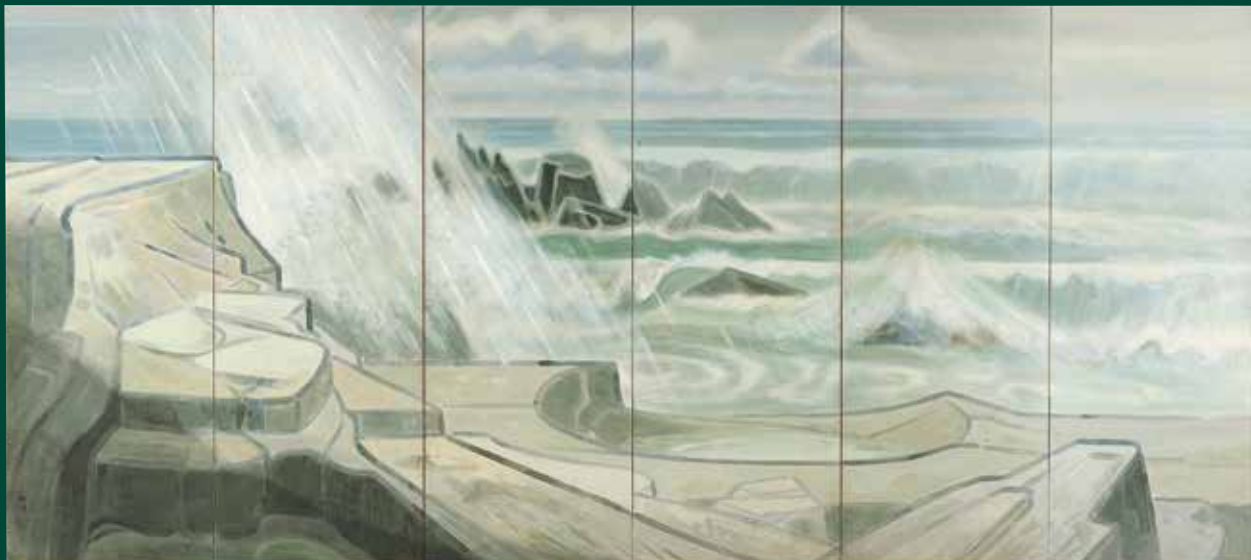
<海> 1940年 富山県水墨美術館所蔵 [後期展示]