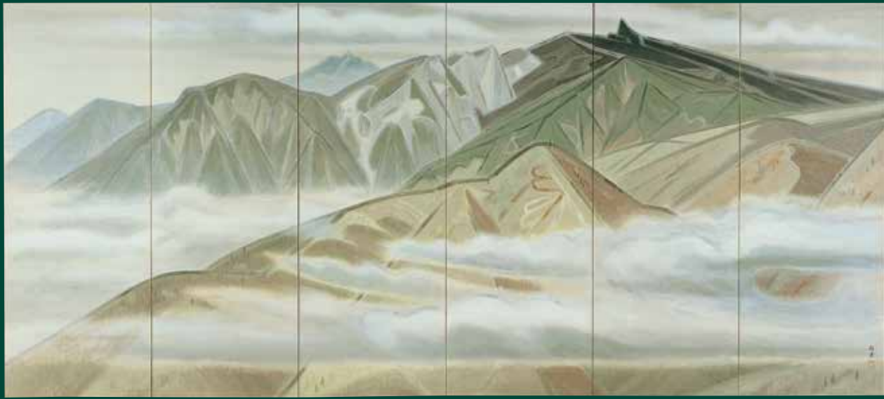
<山> 1940年 富山県水墨美術館所蔵 [前期展示]